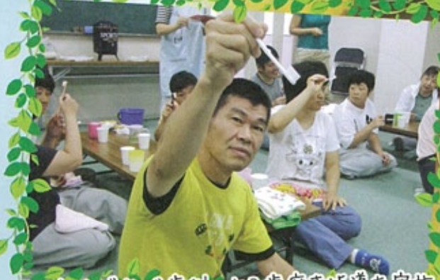
△ しげなが歯科による歯磨き指導を実施