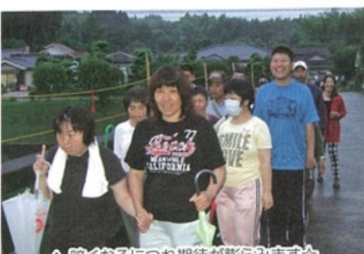
△暗くなるにつれ期待が膨らみます☆