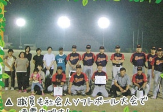
△ 職員も社会人ソフトボール大会で 連覇中です!