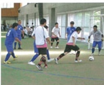
▲ ハットリックが続出!