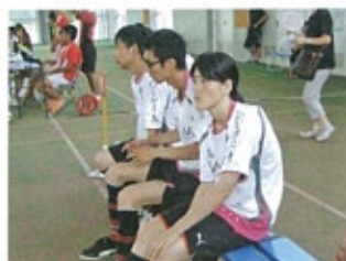
▲ 新たな戦力が加わり、チームも華やかに!

この大会を通じて利用者の皆さんが競技も応援にも一生懸命な姿を見て感動したのと同時に仲間やチームワークの大切さを痛感しました。今後利用者の方々とスポーツを通していろいろな事を学んでいきたいと考えています。