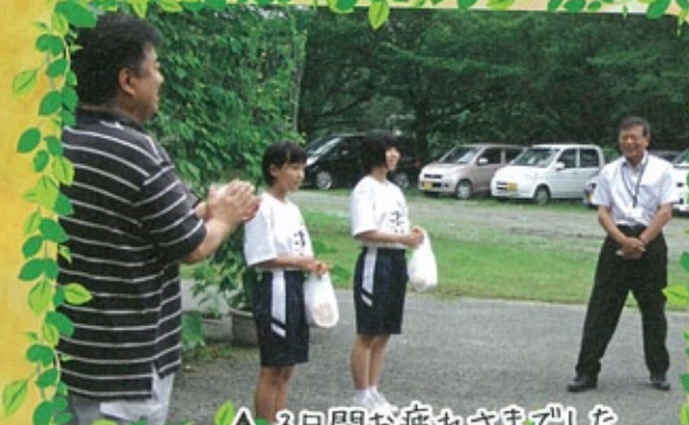
△ 3日間お疲れさまでした @植脇中学校職場体験実習