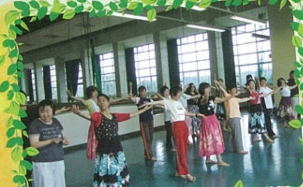
△ 地域のみなさんと合同のフラダンス練習♪