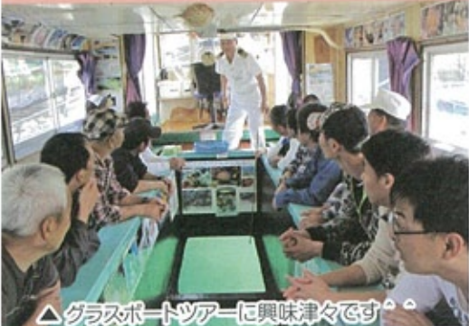
△グラスボートツアーに興味津々です。