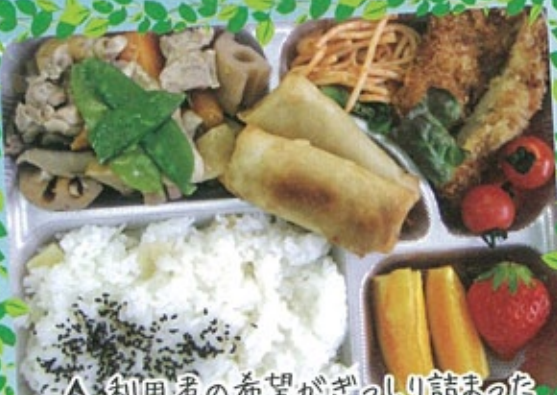
△ 利用者の希望がぎっしり詰まった 手作り弁当☆☆☆