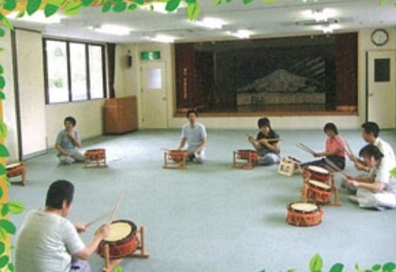
△ 夏祭り本番まで太鼓の特訓です^^;