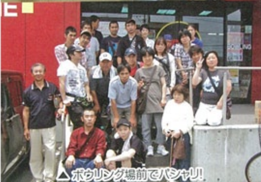
△ボウリング場前でハシャキ