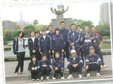
▲メダルをたくさん持って帰る事ができました♪

今年の前年に比べて参加者が少なかったのですが、来年は更に練習を重ね多くの方が参加出来る様皆が一丸となつて取り組んでいきたいと思