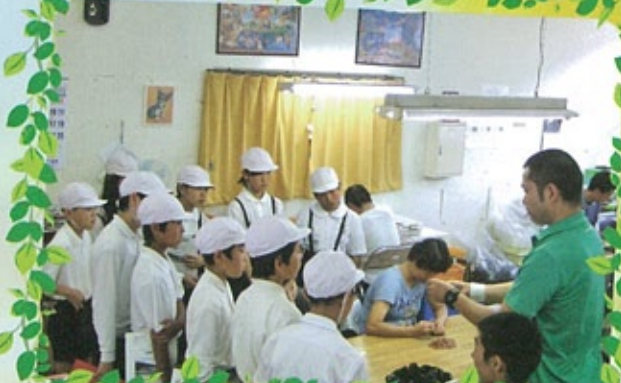
△ 植脇小学校体験学習