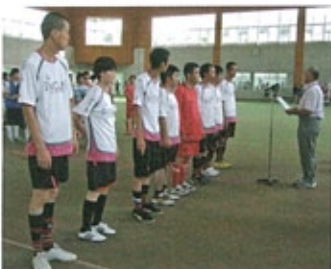
▲ 準優勝おめでとう!

この大会を通じて利用者の皆さんが競技も応援にも一生懸命な姿を見て感動したのと同時に仲間やチームワークの大切さを痛感しました。今後利用者の方々とスポーツを通していろいろな事を学んでいきたいと考えています。