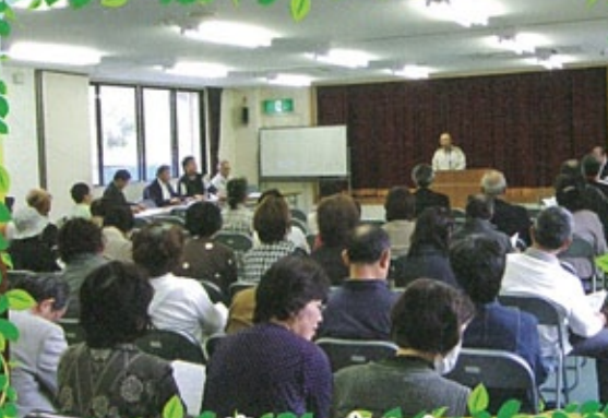
△ 第1回 家族会