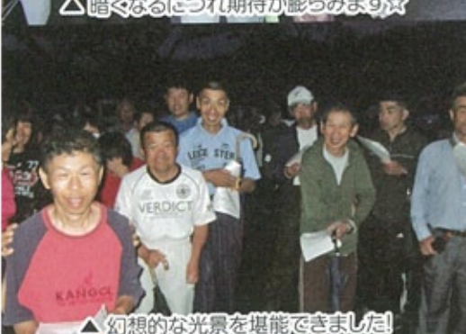
△幻想的な光景を堪能できました!