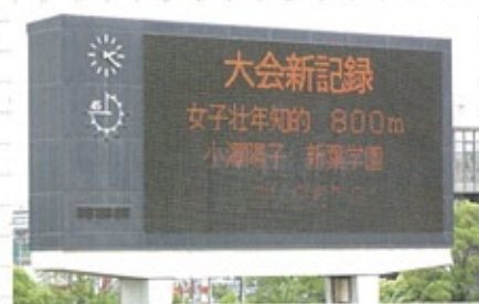
▲大会新記録おめでとう!!