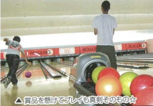
△賞品を懸けてプレイも真剣そのもの☆