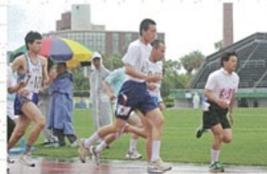
▲デッドヒートの連続!