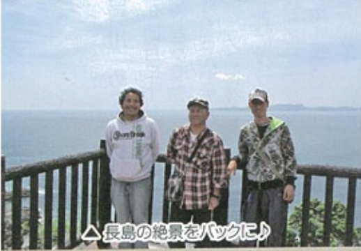
△長島の絶景をバックに♪