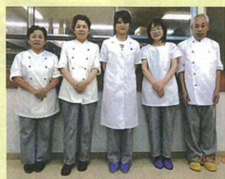
▲(株)魚国総本社の皆さん

会社が変わり利用者の皆様も戸惑うこともあったと思います。私自身も新しい職場に慣れるのに必死で、三ヶ月があつという間に過ぎて行つたような感じがします。しかし、皆様から「美味しかったよ!」「また作ってね!」という声掛けや言葉にとってもやりがいを感じております。これからも皆様が笑顔に、そしてハッピーになれるような美味しく安心安全な食事を厨房の皆さんと一緒に届けたいと思っておりますので、今後ともどうぞよろしくお願ひ致します。