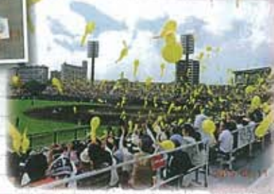
▲ホークスカラーのジェット風船で球場の盛り上がりも最高潮に。

また、球場で食べた昼食のお弁当はとてもおいしかったです。天気にも恵まれ最高の野球観戦でした。また鹿児島である時はぜひ行きたいです。