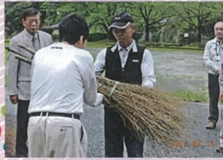
▲前床自治会ふれあいサロンの皆様、誠に有り難う御座いました