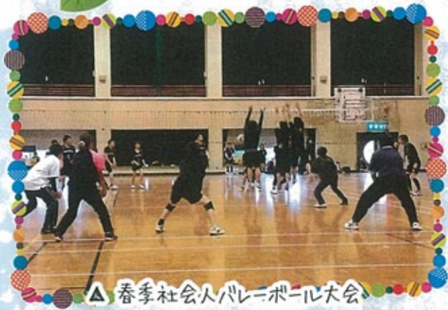
△ 春季社会人バレーボール大会