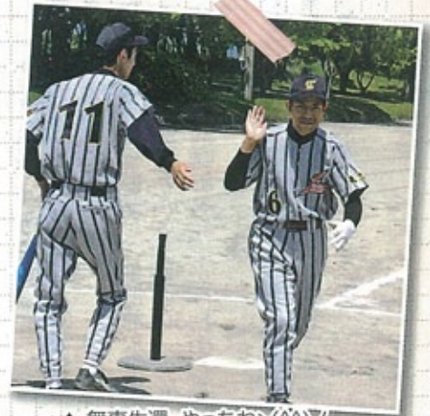
▲無事生還。やったね〜(^^)♪

四月二十五日(土)桜島溶岩グラウンドと体育館で、ティーボール・グラウンドゴルフ・ソフトバレーボールの施設親善球技大会が行われました。試合では練習の成果がどの程度残せるか心配もありましたが、応援席からは熱い声援・本人達のやる気で、ティーボール 準優勝、グラウンドゴルフ 一位、四位、ソフトバレーボール 優勝という見事な結果を残すことが出来ました。プレッシャーの中、練習を共にした仲間たちと励まし合いながら臨み、とても良い経験になったと思います。来年も素晴らしい成績を残せるよう、皆で頑張りたいと思います。応援をして下さった方、大会スタッフの方々には感謝の気持ちで一杯です。本当にありがとうございました。