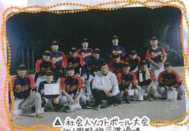
△ 社会人ソフトボール大会 祝!岡野旗 準優勝