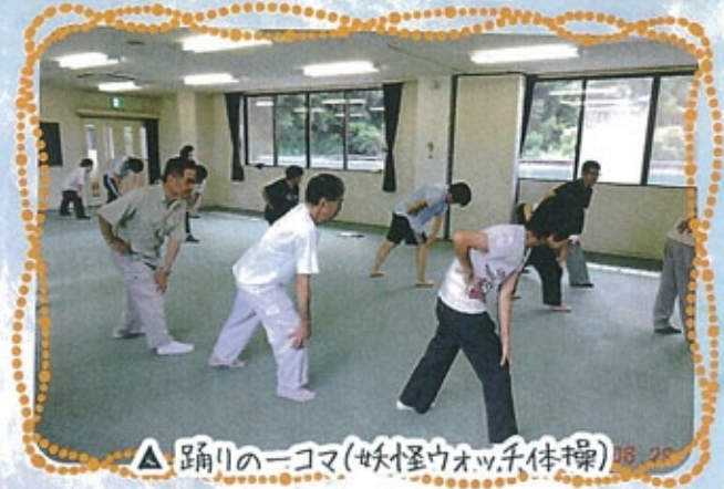
△ 踊りの一コマ(妖怪ウォッチ体操) 08.28