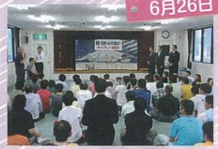
▲ホールインワン記念コンペチャリティー贈呈式