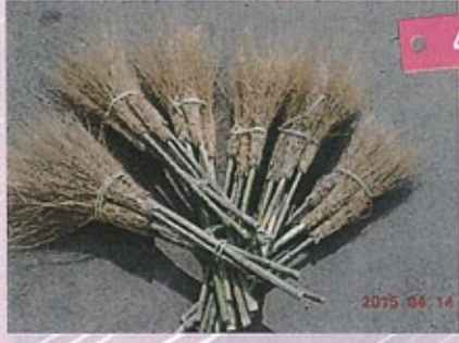
▲環境美化活動、頑張りますm(_)_m