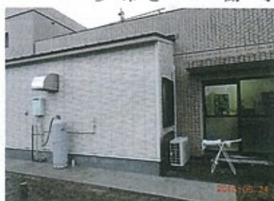
▲拓洋ハイツ 厨房増設

新しい厨房が出来て働きやすくなり、世話人一同大変喜んでおります。衛生面にも十分配慮され、利用者様に安心して美味しい食事の提供をして参りたいと思っております。