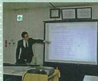
▲ジブラルタ生命認定チーフインストラクター