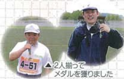
▲2人揃つてメダルを獲りました