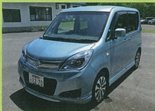
▲快適な乗り心地で大変好評です◎

新たに車輛を購入しました。車内は広々としてとても乗り心地が良く、利用者さんの受診や外出等の送迎に活用したいと思います。