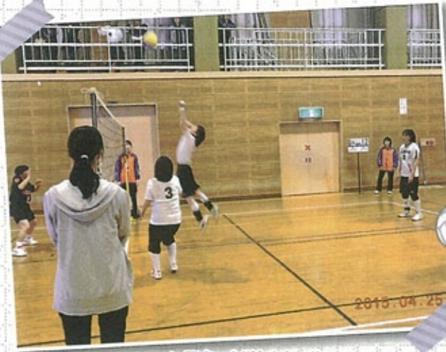
▲アタック!!決まれっ!!