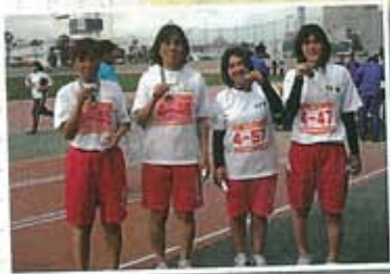
▲一丸となって頑張りました(^)v

大会前日までは十分な練習も出来ず大会新記録こそ出ませんでした。皆さん一生懸命頑張りが、金メダル十四個、銀メダル六個、銅メダル二個の計二十二個のメダルを獲得する事が出来ました。利用者の中には悔しさのあまり涙される方もいましたが、来年はさらに練習を重ね、今年以上の成績が残せるよう一丸となって頑張つていきたいと思ひます。