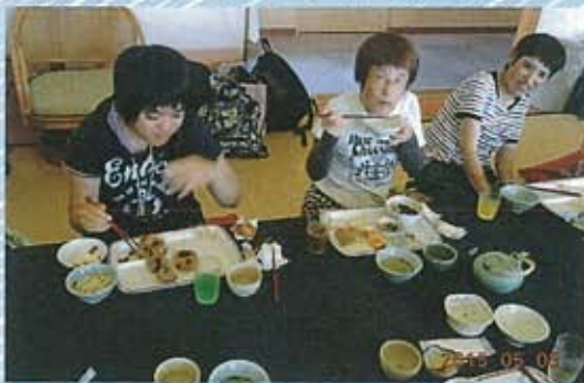
▲レストランバイキング @白浜温泉

昼食バイキングは、沢山の料理に舌鼓を打ち、思い思いに堪能されていました。また温泉ではゆったりとした時間を過ごされ、心も身体もリフレッシュ出来たと好評に至りました。