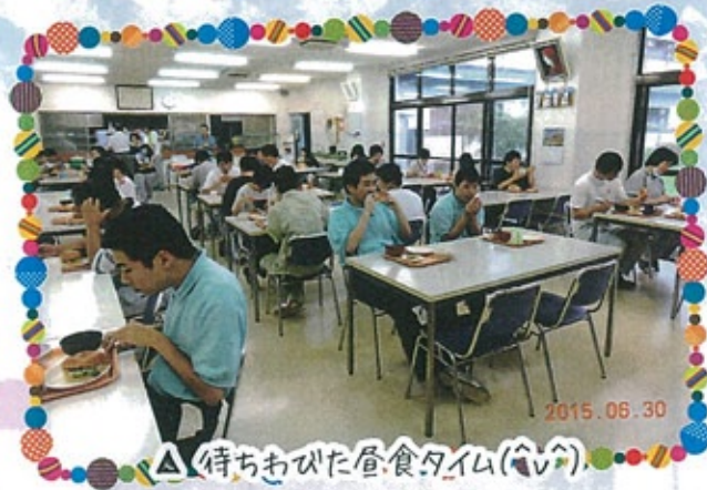
△ 待ちもめた昼食タイム(♡♡)