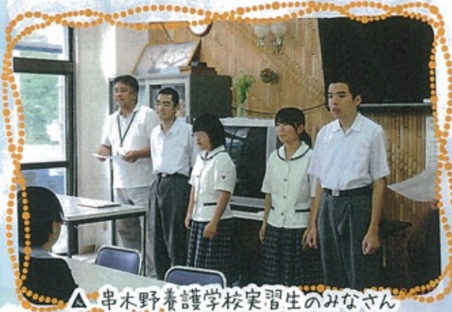
△ 串木野養護学校実習生のみなさん