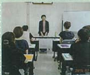
▲薩摩川内市男女共同参画審議会