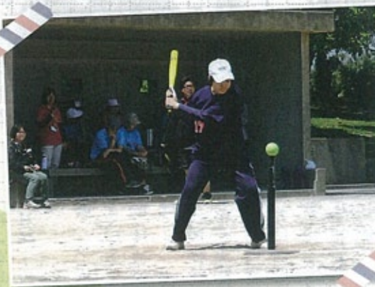
▲私だって負けらんないわっ

四月二十五日きゆうぎ大会に出てティーボールに出ました。ヒットがでてとてもうれしかったです。ゆうしゅつ出来なかったのがさんねんでした。らいねんもたくさん練習してティーボールに出たいです。