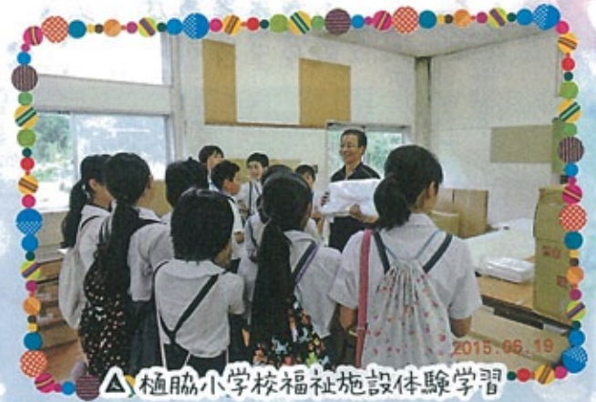
△ 植脇小学校福祉施設体験学習