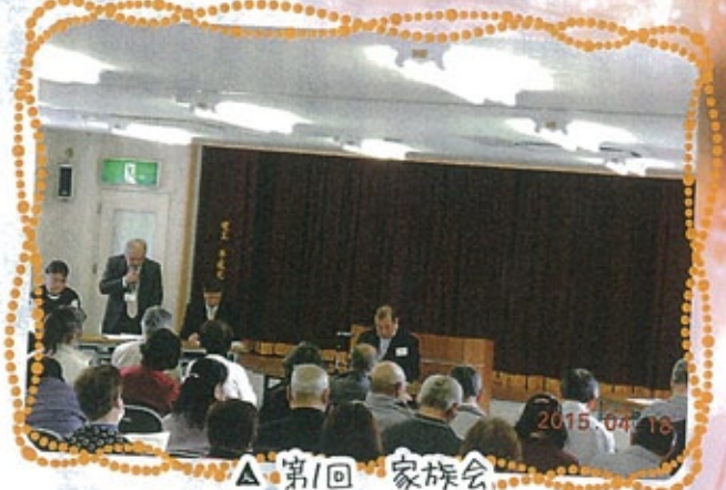
△ 第1回 家族会