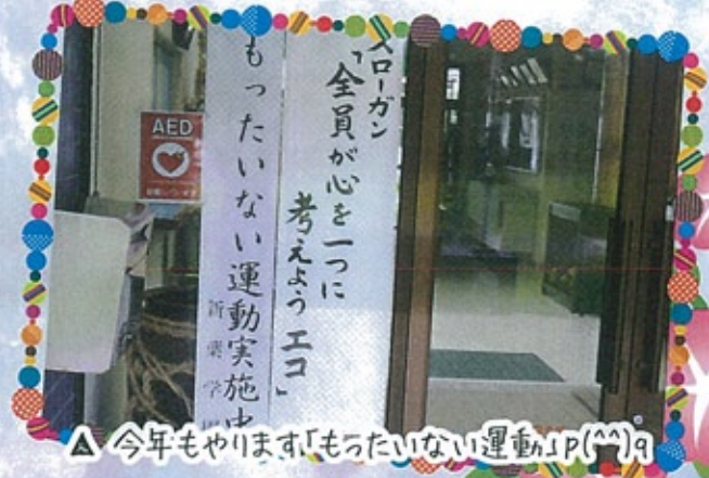
△ 今年もやります「もったいない運動」P(^^)q