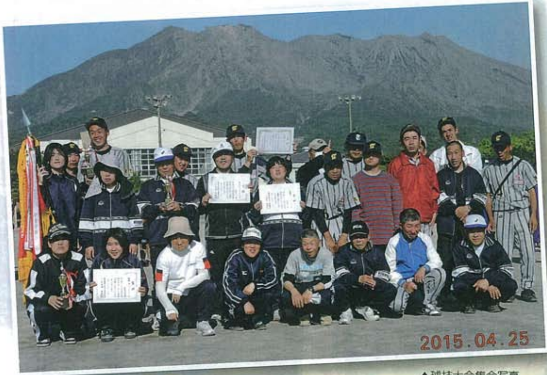
▲球技大会集合写真