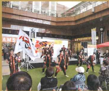
▲ ノウフクマルシェ 10月15日 アミュプラザ