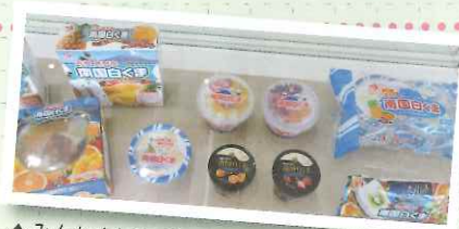
▲みんな大好き「セイカの白熊」(●^o^●)