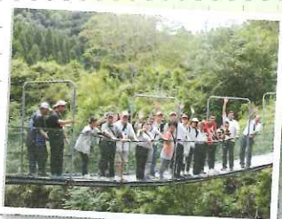
▲結構高いけど大丈夫 (°o°);)

その後、「ニシムタ・伊集院店」 で日用品などを購入し、利用者 と職員の親睦を図ると共に日頃の 労を労って心身ともにリフレッ シユする事が でき、大変有 意義なレクリ エーション であった。