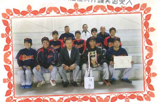
▲拓洋会杯ソフトボール大会 祝！優勝！