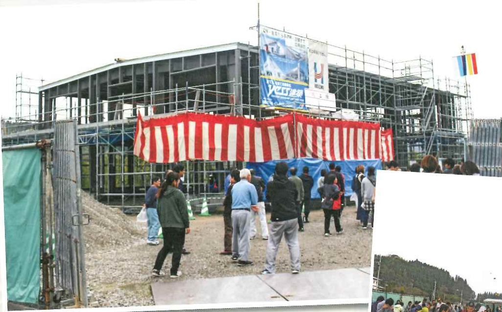
▲ 11月27日 上棟式の様子

発行者 社会福祉法人 拓洋会 薩摩川内市樋脇町塔之原 4020 TEL: 0996-37-2861 FAX: 0996-37-2981 http://takuyoukai.kobira05.info