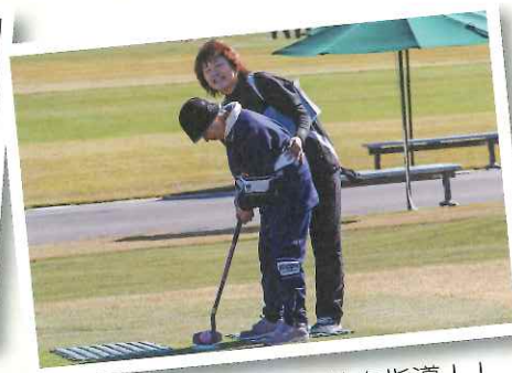
▲永吉支援員の熱血指導！！