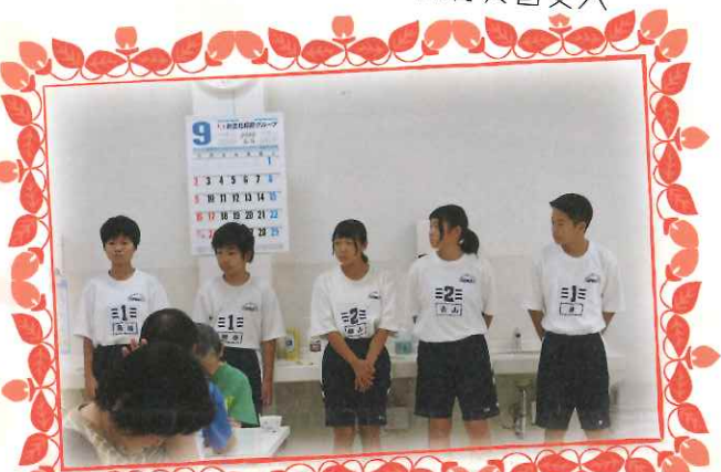
▲樋脇中学校職場体験学習受入