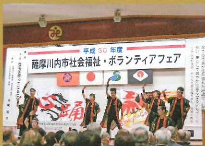
▲ 社会福祉・ボランティアフェア 11月10日 社会福祉協議会