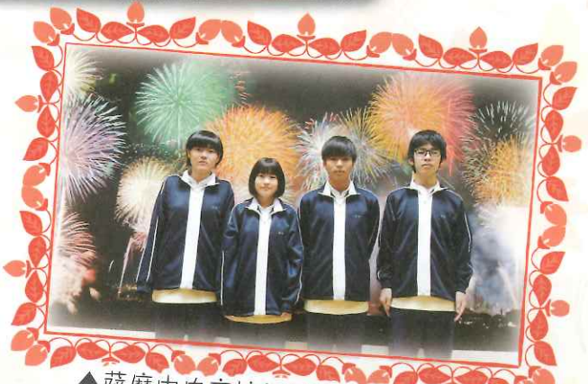
▲薩摩中央高校福祉科介護実習受入