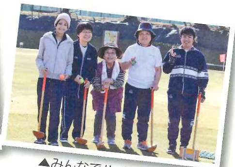
▲みんなでハイチーズ