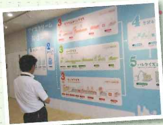
▲いつでも研究熱心な下川課長 (..)φ★熱男★