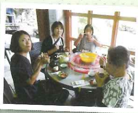
▲夏はやっぱり ソーメン流しだね♪

その後、「ニシムタ・伊集院店」 で日用品などを購入し、利用者 と職員の親睦を図ると共に日頃の 労を労って心身ともにリフレッ シユする事が でき、大変有 意義なレクリ エーション であった。