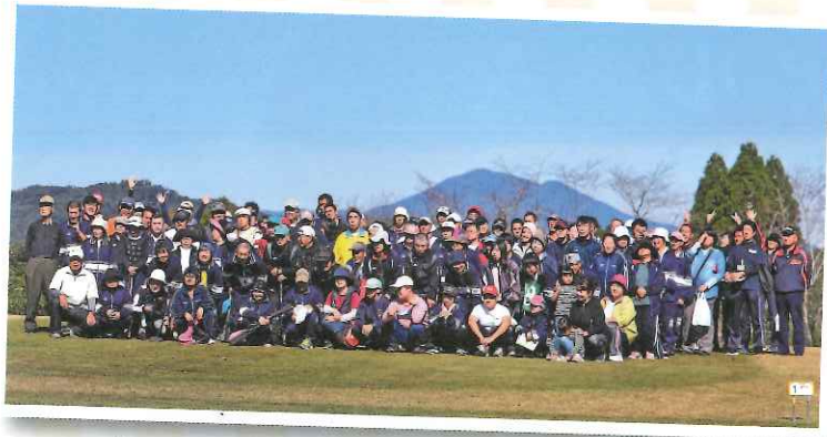
▲グラウンドゴルフ大会後にみんなでハイ！チーズ！

グラウンドゴルフ大会は前日の雨でコースがしめついていたが、天気のよいなかで大会ができてよかった。 楽しくみんなとできた。 コースによっては、むずかしい所もあったが、最後までプレイできてよかったです。