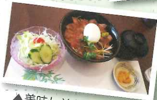
▲美味しそうなお肉に 温玉をのせて〜!!