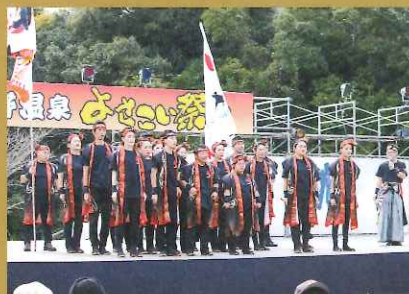
▲ 市比野温泉よさこい祭り 11月24日 市比野グリーンランド