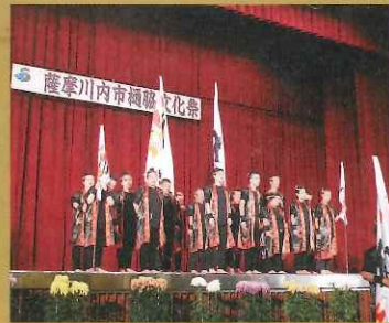
▲ 樋脇文化祭 11月3日 樋脇体育館