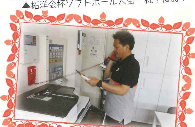
▲夜間避難訓練（通報訓練の様子）