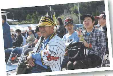
▲みなさん、出店やアトラクションを楽しんでいらっしゃいました！

みんなが最後まで「しんよう秋まつり」を楽しんでいました。来年も楽しめたらいいなと思います。