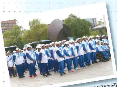
▲県庁前にて 鹿児島県選手団結団式♪