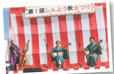
▲藤本樋脇支部のみなさま