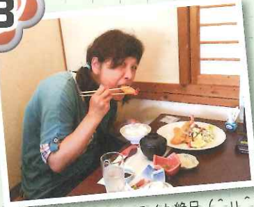
▲エビフライも絶品(〜u〜)