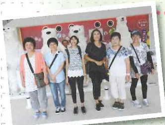
▲ハイチーズ!!あれ!白熊の間から ひょっこり・・・(°Д°o)!!

去る八月十三日(月)入 所在園者のレクリエーショ ンが実施され、さつま町 にある鶴田ダムへあびー る館に出掛けました。平成 二十九年十月にグランド オープンした川内川大鶴ゆ うゆう館の展示室で川内川 流域のジオラマ模型や北部 豪雨災害の記録、また発電 の仕組みを体験しながらダ ムへの理解や関心を深め、 分り易く学ぶ事が出来まし た。昼食はあびーる館に立 ち寄り、好きなメニューを 注文し普段味わえない雰 囲気を満喫されていたよう です。食後は天然温泉でゆっ たり過ごし、帰りは楽しみ にしていたアイスクリーム を食ベレクリエーションを 締めくくりました。