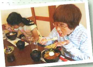
▲ステーキ丼(温玉付) さいご〜♪