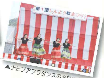
▲ナヒブアフラダンスのみなさま