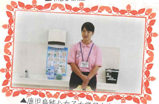
▲鹿児島純心女子大学保育実習受入