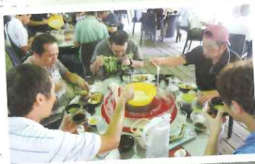
▲皆よく食べる(〜°Д°〜) 麵の追加が追いつきません(笑)

八月二十三日にそうめん 流しに行き、お昼ごろにつ いてからそうめんなどを食 べてとてもおいしかったで す。午後からはセイカ工場 見学にいきました。工場内 にはアイスをつくる人た ちがたくさんいて、いっしょ うけんめいに作っていました。 アイスを食べとても おいしかったです。