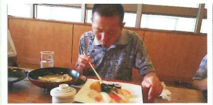
▲エビ・イカ・マクロ・・・どれから食べようかなあ〜(〜人)♥