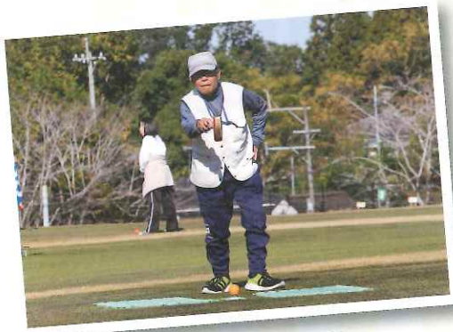
▲ねらって、ねらって～

去る十一月十七日にスポーツレクリエーション大会が樋脇グラウンドゴルフ場で開催されました。前日の雨が嘘のように晴天に恵まれ、絶好の大会日和となりました。家族・利用者・職員が五人一組となりプレーが始まりました。中には初めてグラウンドゴルフをされる方もいらっしやう、一ラウンド八ホールの短いコースでしたが、どのチームも笑顔で楽しくプレーをされていました。 大会を通して、利用者さん達の笑い声、保護者と一緒に過ごされる表情は、何にも代えがたい素晴らしいものでした。