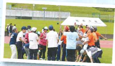
▲皆で力合わせて! がんばろー