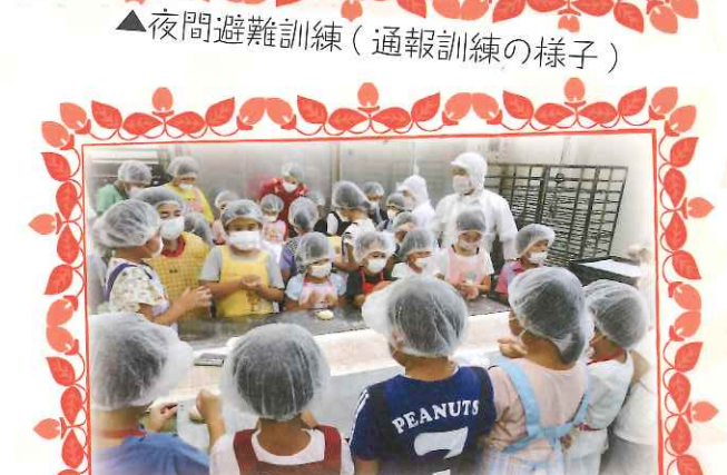
▲パン製造体験～樋脇白ゆり児童クラブの皆さん