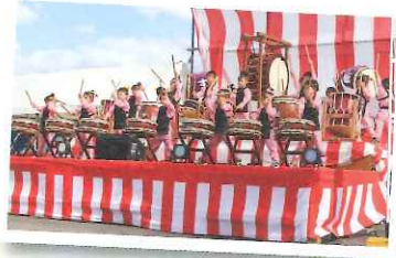
▲かわいくて迫力のある太鼓でした（すわこども園）！！