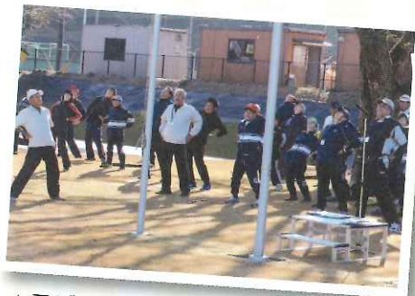
▲ラジオ体操で体をほぐしましょう！