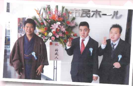
▲やったー！20歳になったー(^^)-☆

しました。成人を迎えて仕事をがんばりたいです。うちでは草取りや家族と一緒に出かけしてゴーカーに乗りたいです。