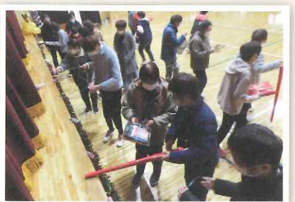
▲宝釣りゲーム!! みんな、ひっばれひっばれ～\(^o^)/(^o^)/