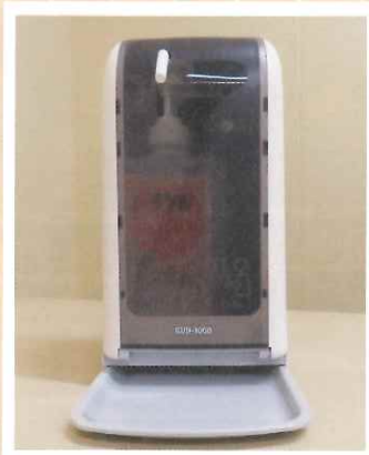
▲アルコール自動 ディスペンサー

ワクチン接種が何時出来るか、まだ不明であり、ワクチン接種を行っても感染する可能性があるため、今後も感染予防徹底を行う必要があります。 「手洗い、嗽、マスク着用、手指消毒」 に限ると考えます。