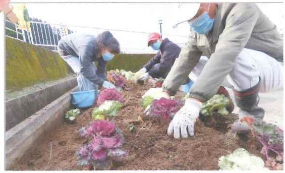
▲環境美化活動（花壇の手入れ）