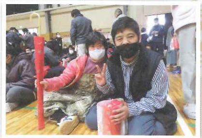
▲何が当たったかなあ？