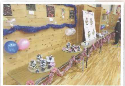
▲素敵な作品が出来ました(∩O∩)

きぼをしゅくしゅうしたクリスマス会がありました。その中で劇がありました。とてもおもしろかったです。その後じゃんけんゲームがありました。最後に各班に分かれて、宝つりをしました。今年も、楽しいクリスマス会ができるといいなと思っています。