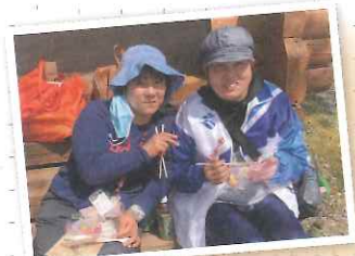
▲ピクニック弁当おいしいなあ～！唐揚げ1つ頂戴^o^