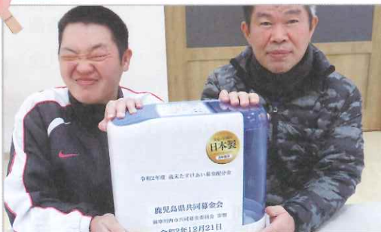
▲鹿児島県共同募金会より寄贈を賜りました