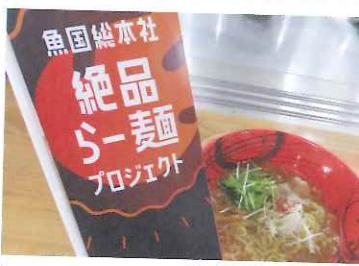
▲らー麺プロジェクト開催

まずは視覚から：という事で、普段の制服をラーメン企画オリジナルポロシャツとキャップに一変。更にはラーメン丼ぶりやBGMも準備させて頂き、本物のラーメン店を彷彿とさせる仕上がりとなりました。勿論、味も格別！目の前で仕上げられる熱々のラーメンに皆様のテンションも急上昇です。普段とは異なるスタイルでの食事提供で、少しでも非日常を味わって頂けたのではないかと思います。皆様の一日の楽しみ大きな役割を果たす「食」。今回の自粛期間中に更にその重要性を実感出来たのではないのでしょうか。