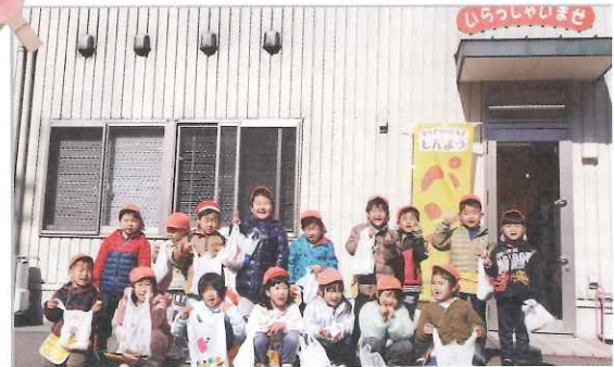
▲善福寺保育園の皆さんがパンを買いにきてくれました。