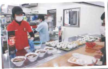
▲人気ラーメン店さながらの食事提供!!

新型コロナウイルスの蔓延により、私達の生活も一変しました。そんな中、あらゆる自粛を余儀なくされている皆様にも少しでも食事で元気になってもらおうと、魚国総本社が立ち上がり、イベントを企画致しました。その名も「魚国総本社オリジナル 絶品らー麺プロジェクト」です。これは、有名人気ラーメン店をベンチマークとした四種類の本格的なラーメンを、より外食店に近付けた形で提供しようという企画です。