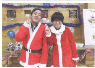
▲司会お疲れ様でした