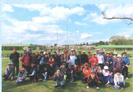
▲春のスポーツレクリエーション大会(生活介護事業所)

次年度こそは、たくさんの行事が開催され利用者さんの楽しい姿を沢山見られることを願っています。