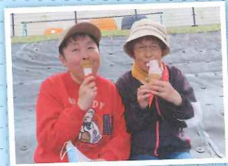
▲グラウンドゴルフ後のアイス冷たくて美味しい～！

三月二十四日はみんなと楽しいグラウンドゴルフをしてまわりました。なかなかスムーズにボールがころがっていかなくてたいへんでした。天気もよくて桜もまんかいですごくきれいでした。グラウンドゴルフをしているうちに暑くなって、その後にみんなが食べたソフトクリームが美味しかったです。楽しい一日を過ごせてよかったです。