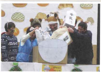
▲美味しいパンが出来るかな!?