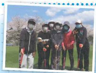
▲イエーイ！ひわきYOU遊女性チーム