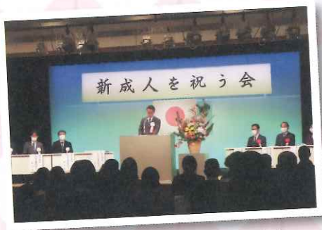
▲新成人を祝う会記念式典

しました。成人を迎えて仕事をがんばりたいです。うちでは草取りや家族と一緒に出かけしてゴーカーに乗りたいです。