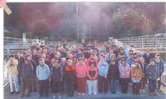
▲仕事始め式（利用者）