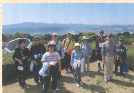
▲絶好のレクリエーション日和だぁ～^^

三月二十五日にB型のスポーツレクリエーションがありました。3kmウォーキングとグラウンドゴルフ、せんだい宇宙館のコースに分かれ、それぞれ楽しみ笑い声が聞こえていた。雨が降り行けるか心配だったが晴れたので良かった。皆と食べるお弁当は最高に美味しかった。又、全員で行けたらいいな。僕はせんだい宇宙館で天体観測を体験しました。宇宙は謎ばかりだなと思いました。