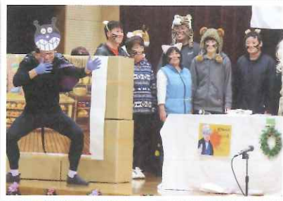
▲バイキンマン参上★