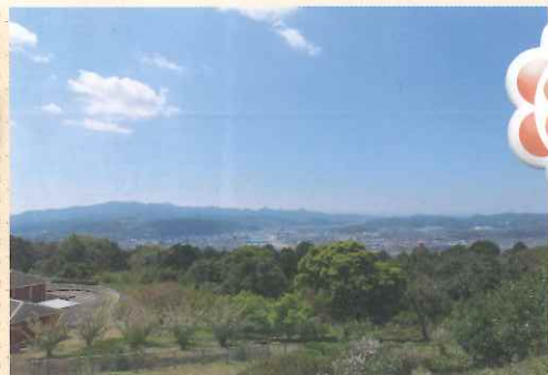
▲寺山からの我が町薩摩川内！

三月二十五日にB型のスポーツレクリエーションがありました。3kmウォーキングとグラウンドゴルフ、せんだい宇宙館のコースに分かれ、それぞれ楽しみ笑い声が聞こえていた。雨が降り行けるか心配だったが晴れたので良かった。皆と食べるお弁当は最高に美味しかった。又、全員で行けたらいいな。僕はせんだい宇宙館で天体観測を体験しました。宇宙は謎ばかりだなと思いました。