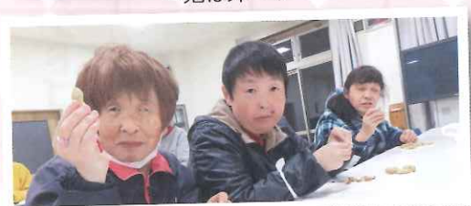
▲豆は美味しいねえ(^^)