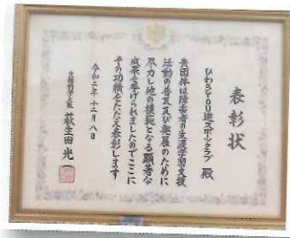
▲ひわき YOU 遊クラブ表彰