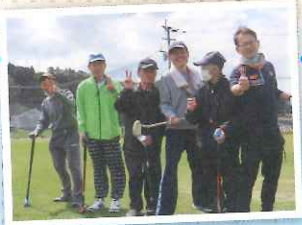
▲我ら！ひわきYOU遊チーム！(^^)!