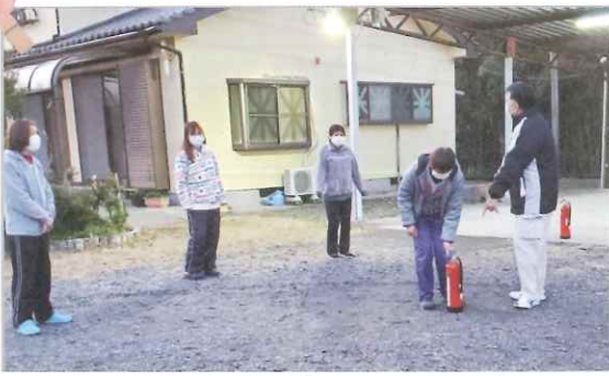
▲グループホーム避難訓練の様子