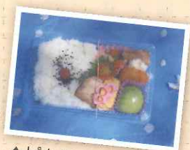
▲ピクニック弁当参上！美味しそう～

三月二十五日、寺山公園にてB型のスポーツレクリエーションが行われた。前夜から雨が降り開催出来るか心配していたが思ったより早く天気回復し最高の行楽日和となった。到着後すぐの昼食。美味しいお弁当を外で食べるのは格別でした。その後、ウォーキングをされる方、グラウンドゴルフをされる方に分かれそれぞれ職員と一緒に過ごし、普段あまり話した事のない利用者さんと楽しく過ごせた事が嬉しかったです。又、利用者さんが口を揃えていつか皆と一緒にどこかに行きたいと話された事が印象に残りました。コロナ禍の中で長時間の自粛生活を余儀なくされストレスを感じている中、今回の様な楽しい一時を過ごせて良かったです。