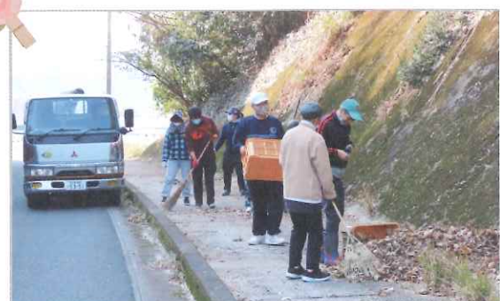
▲地域貢献活動の様子