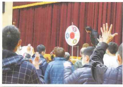
▲じゃんけんゲーム 🎲🎲🎲