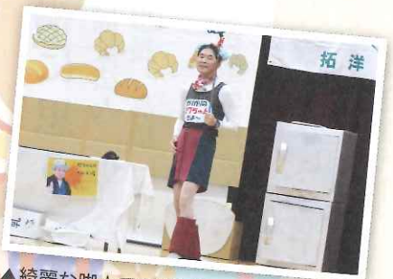
▲綺麗な脚☆でも実は課長だよ～(°Д°)

新型コロナウイルスの感染拡大防止の為に、様々な行事が自粛や中止される中、唯一行われた屋内でのクリスマス会でした。利用者と職員による演劇では、見ている方に笑顔と笑いを届けて下さり、またルーレットを使ったじゃんけんゲーム大会や宝釣りゲーム、屋内には利用者の作品等が展示されており、限られた時間ではありましたが久しぶりに楽しいひと時を過ごす事が出来たと思います。まだまだ厳しい状況での生活が続きますが、新型コロナウイルスの早期収束を願い、元の生活に早く戻る日を心から祈ります。