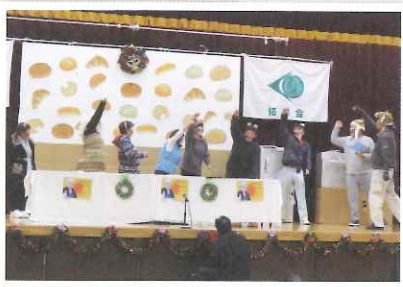
▲頑張って練習しました!!