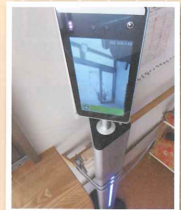
▲サーモマネージャー サーマルカメラ