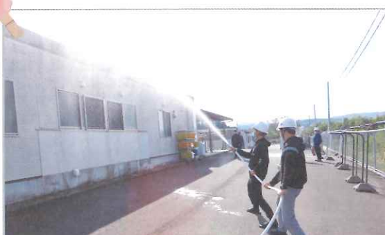
▲総合防災訓練の様子