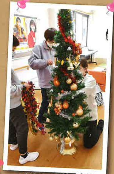
▲クリスマスツリー飾りつけ