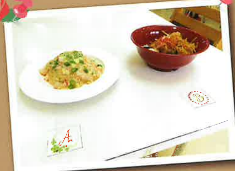
▲どっちにしようかな?セレクトメニュー