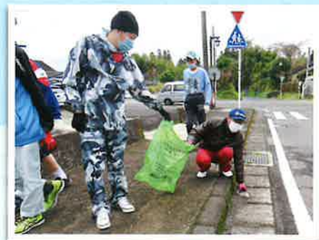
▲ 地域に貢献するぞ!

去る十一月三十日、スポーツレクリエーション(空き缶拾いウォーキング)が開催されました。当日は少し肌寒い中、榎脇鉄道公園と八幡河川敷公園の二コースに分かれて空き缶拾いを行いました。コロナ感染対策を取りつつ賑やかに環境美化を行う事が出来、職員と利用者の交流を深める場ともなりました。ゴール後は、イベント市場さんのご厚意もあり、ポテトフライとアイスクリームを頂き、コロナの影響による自粛生活を忘れさせる位に利用者の皆さんも喜ばれ、とても楽しい時間を過ごす事が出来ました。