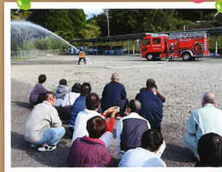
▲消火デモンストレーション