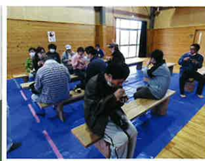
▲ 美味しいモグモグ(〜〜)