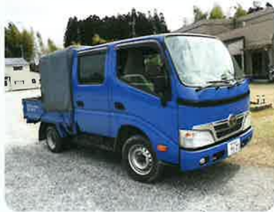
▲トヨタダイナカーゴ

この度、町班活動専用車両が 新しくなりました。住みよい町 づくりに貢献し活躍していま す。安全運転、安全作業を心掛 けていきたいと思えます。