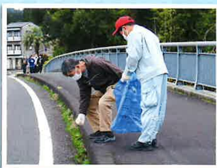
▲ こんなところにもゴミが...

十一月三十日(水)の日に鉄道公園まで空き缶拾いに行きました。コーヒの空き缶やたばこの吸い殻が沢山捨ててありました。昼からはキッチンカーが来園されアイスクリームとフライドポテトの提供がありました。フライドポテトは塩が効いてとても美味しく、アイスクリームはフルーツを上に乗せてあり冷たく甘くてとても美味しかったです。また機会があれば食べたいです。