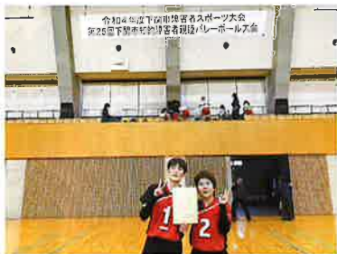
▲「燃ゆる感動がこしま大会」では絶対優勝するぞ!!