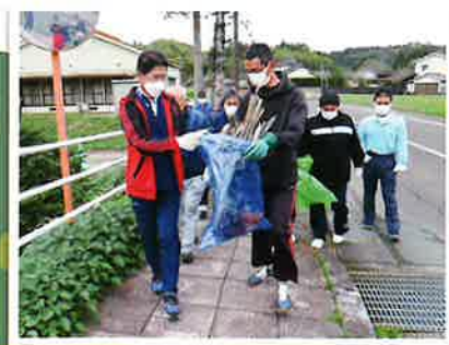
▲ そんなにゴミが落ちてたなんて...