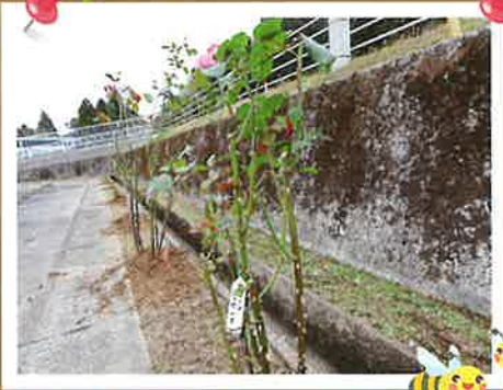
▲綺麗なバラを咲かせてね