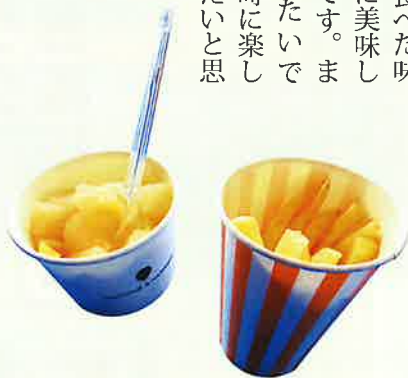
▲ これ絶対ウマイやつ〜♫

それと、ポテトフライとアイスクリームを最後に食べた味は最高に美味しかったです。また食べたいです。同時に楽しみにしたいと思います。