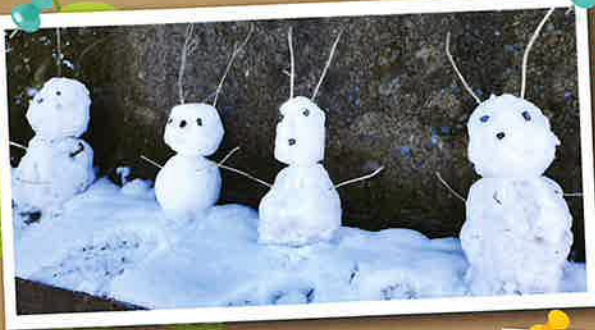
▲1月25日雪だるまを作ったよ