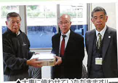
▲大事に使わせていただきます!!

この度、川内第一ライオンズクラブ様より文房具用品を頂戴しました。コロナ禍で自粛生活を強いられるなか、頂きました文房具で利用者さんの何気ない日常に彩りを与えられるよう大いに活用させて頂きます。いつもながらの温かいお気遣いに、心より感謝申し上げます。