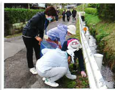
▲ きれいになった道は気持ちいいよねえ(^^)