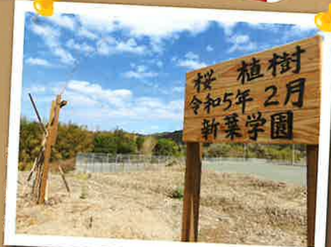
▲新しいグラウンドに桜の木を植えました